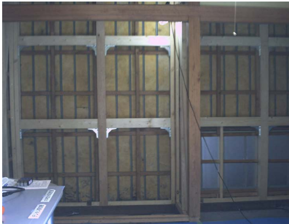
某市役所建築指導課に相談市民：押入れの耐震工事